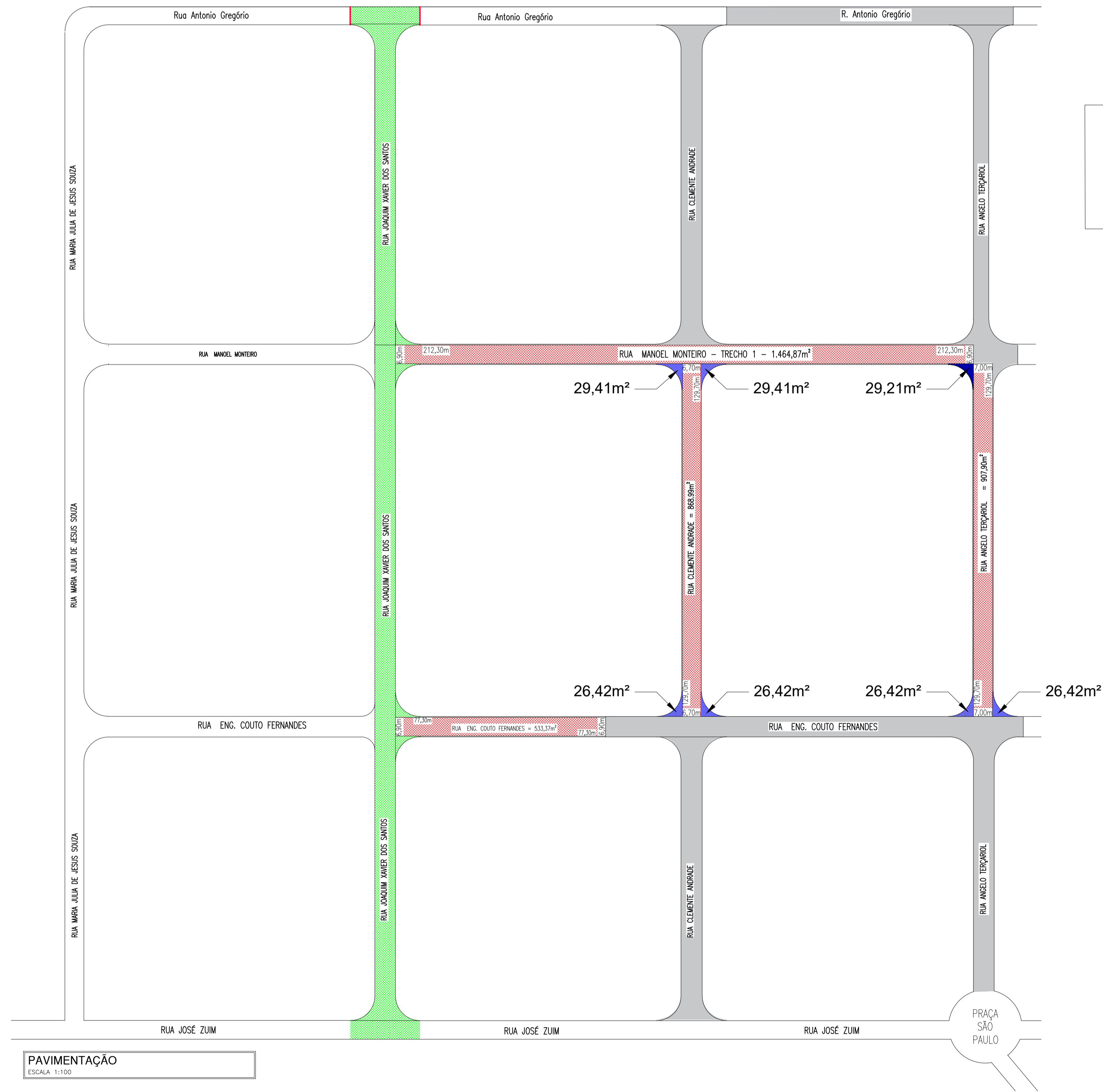
PAVIMENTAÇÃO ESCALA 1:100